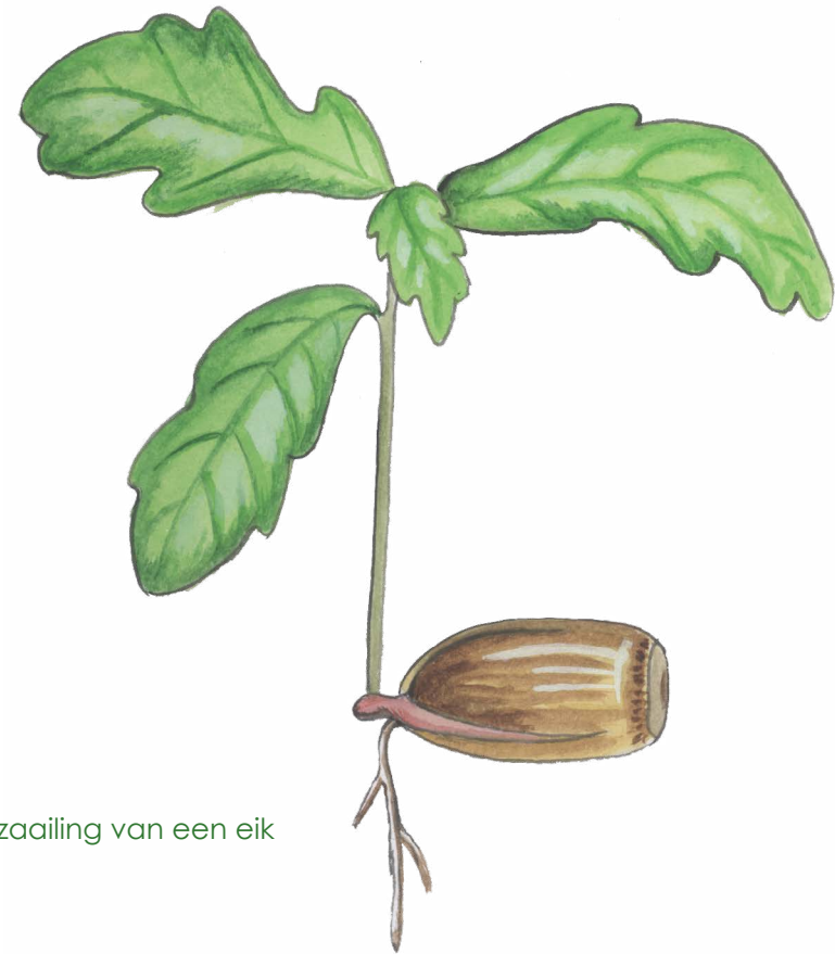
zaailing van een eik

In de zomer maakt de eik eikeltjes, in de herfst vallen de eikeltjes van de boom. Daar kan weer een nieuw boompje uit groeien.