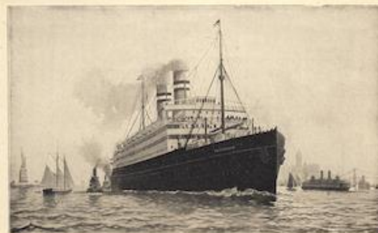
HET S.S. „ROTTERDAM“ VERLAAT DE HAVEN VAN NEWYORK