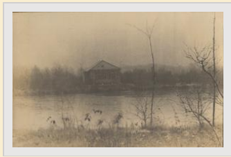
Beno's Stad , 4 maart 2010