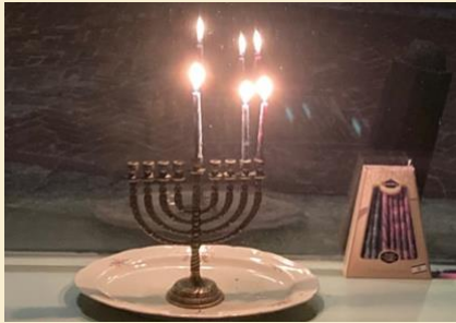
De vorm van de chanoekia kandelaar en de menora herinnert aan een amandelboom in volle bloei.