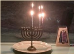
Elke dag een kaarsje meer. Zo herinnert de chanoekia kandelaar 's winters aan de bloeiende amandelboom.