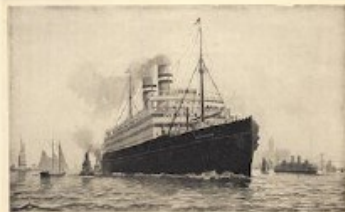
HET AN. 'ROTTERDAM' VERHAAT DE HEINIS VAN ADOFVOSK