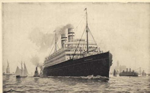
HET S.S. „ROTTERDAM“ VERLAAT DE HAVEN VAN NEWYORK.