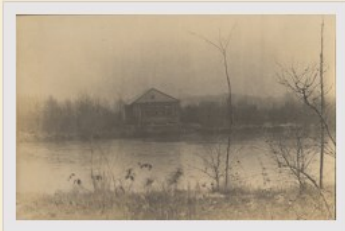
Beno's Stad, 4 maart 2010