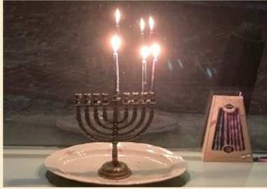
de vorm van de chanoekia kandelaar en de menorah herinnert aan de amandelboom in volle bloei