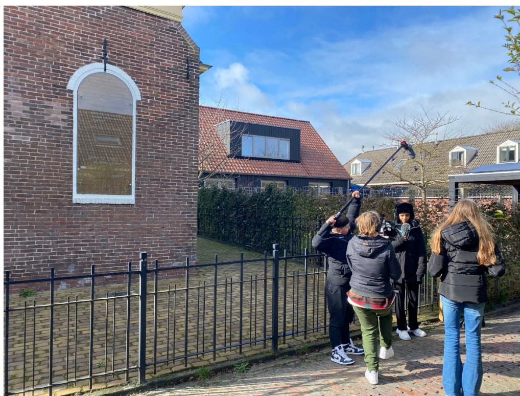
Verslaggeving op locatie voor de HHC Middag Show (met zicht op de nog bladerloze N.A. de Vriesboom)